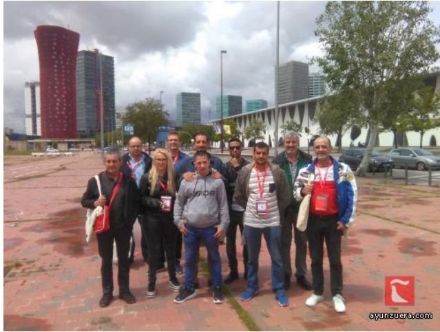
Alumnos trabajadores y monitor a la entrada a la feria