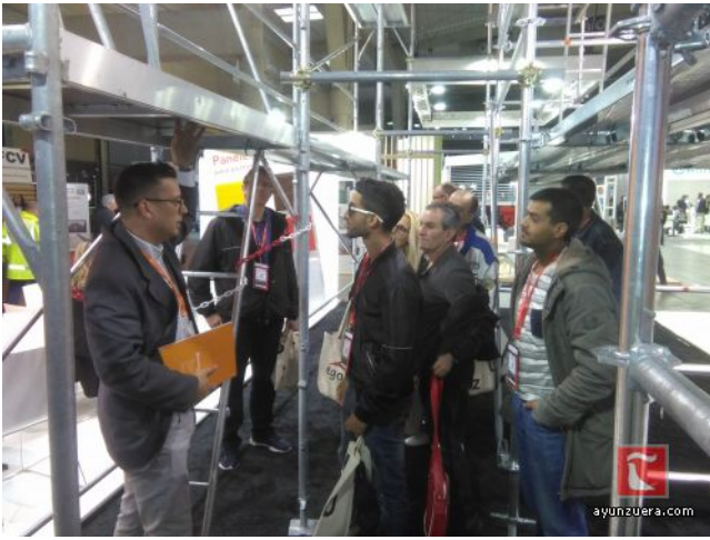
Alumnos y monitores atendiendo a una explicación sobre a ndamios